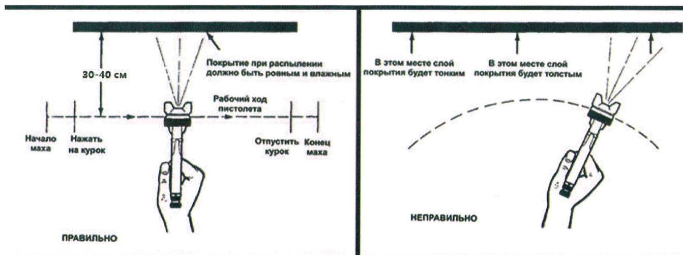
Рисунок 1 – Схема нанесения лакокрасочных материалов

7.10 Контроль толщины мокрого слоя осуществляется поверенным толщиномером мокрого слоя «гребёнкой» по последнему зубу, касающемуся состава. Над каждым зубом гребёнки отмечена величина его зазора в микронах от «базовых» зубьев (от 0). При выполнении измерений гребёнку необходимо устанавливать перпендикулярно к плоскости окрашенной поверхности. После проведения каждого замера поверхность «гребёнки», контактирующую с составом, необходимо тщательно вытереть чистой ветошью.