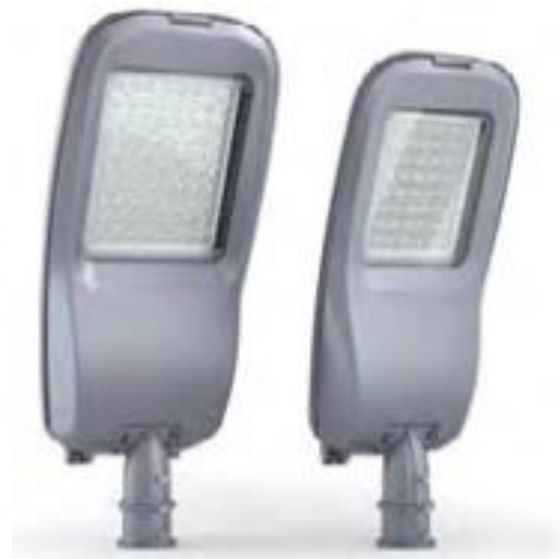
Светильник Wega Lux (50-250Вт).