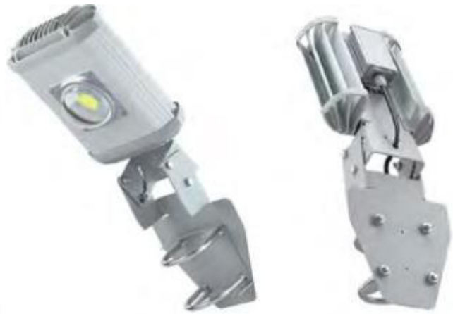
Светильник Astra Street (35-300Вт).