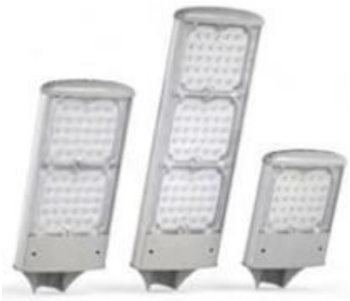
Светильник SIRIUS Eco (55-180Вт).